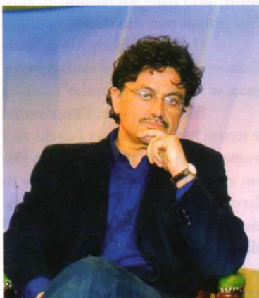
■ Marcello Veneziani, nel suo libro Rovesciare il '68 , ha spiegato che lavorando da soli si pone più attenzione verso il mondo esterno.